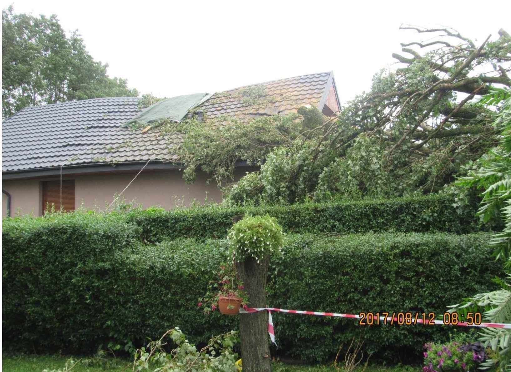
Budynek mieszkalny w Gliszczu