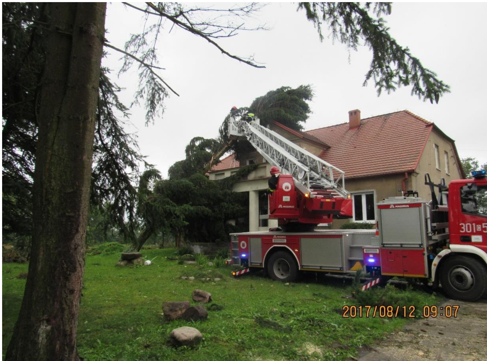
Budynek plebani w Samsiecznie