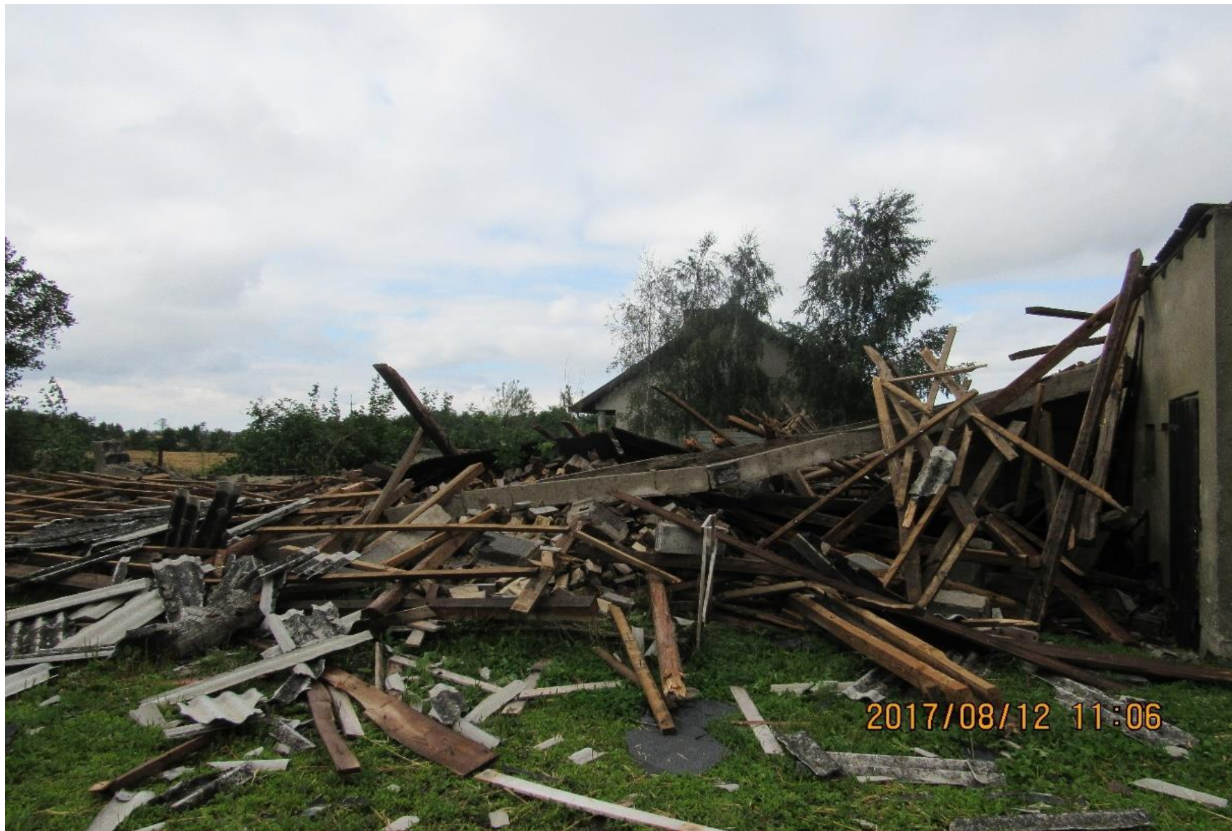
Budynek inwentarski w Murucinie