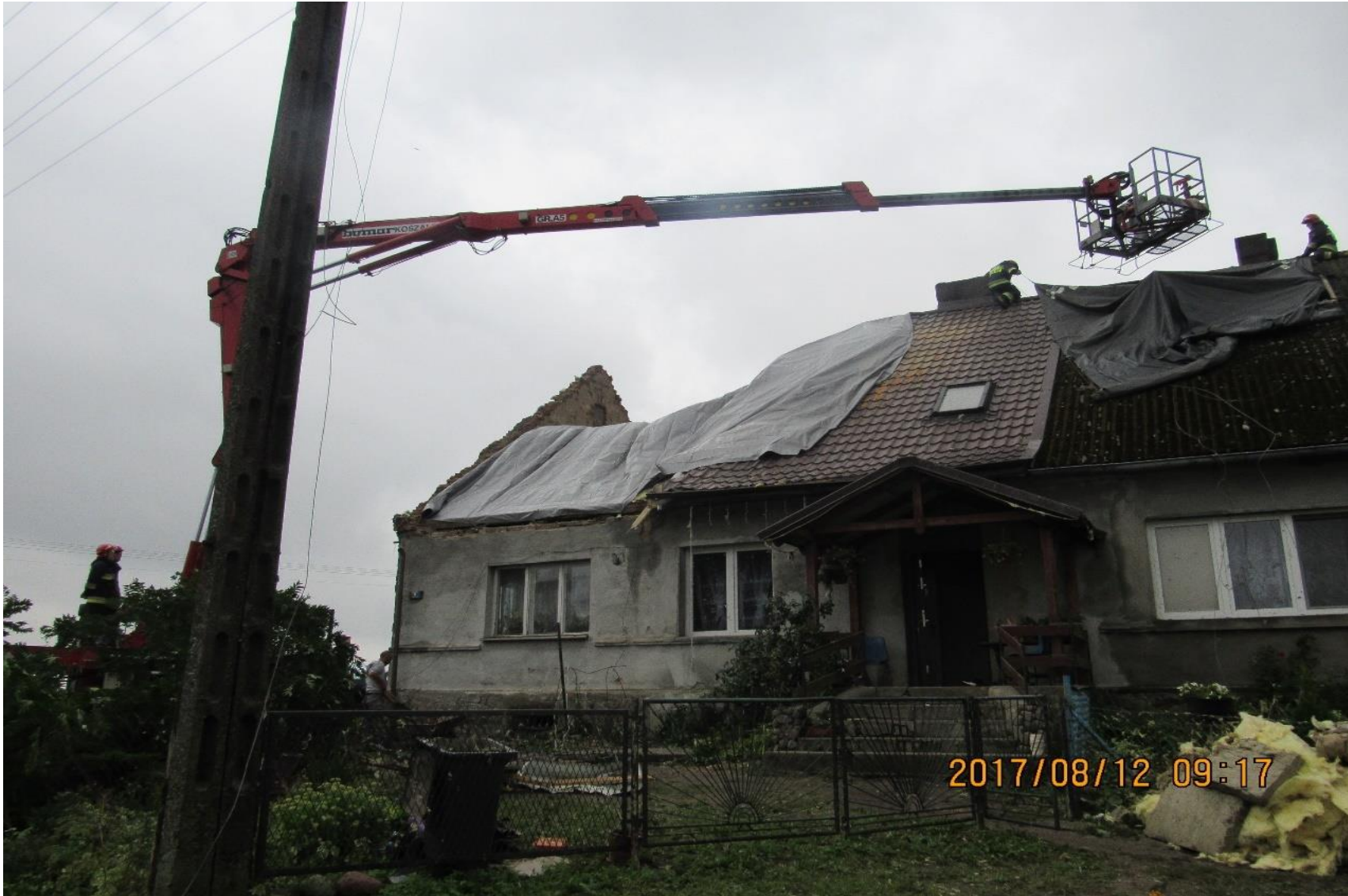
Działania PSP z Bydgoszczy przy zabezpieczaniu budynku w Samsiecznie