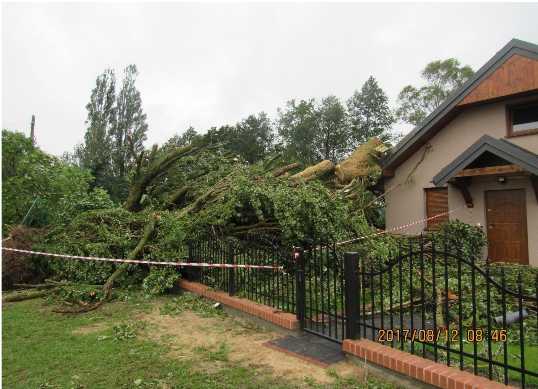
Powalone drzewo na budynku w Gliszczu