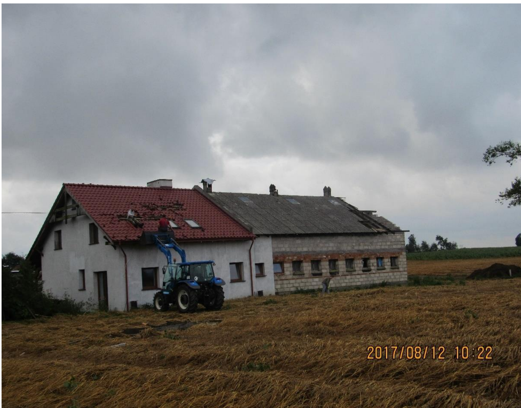
Budynek mieszkalno – inwentarski w Łukowcu