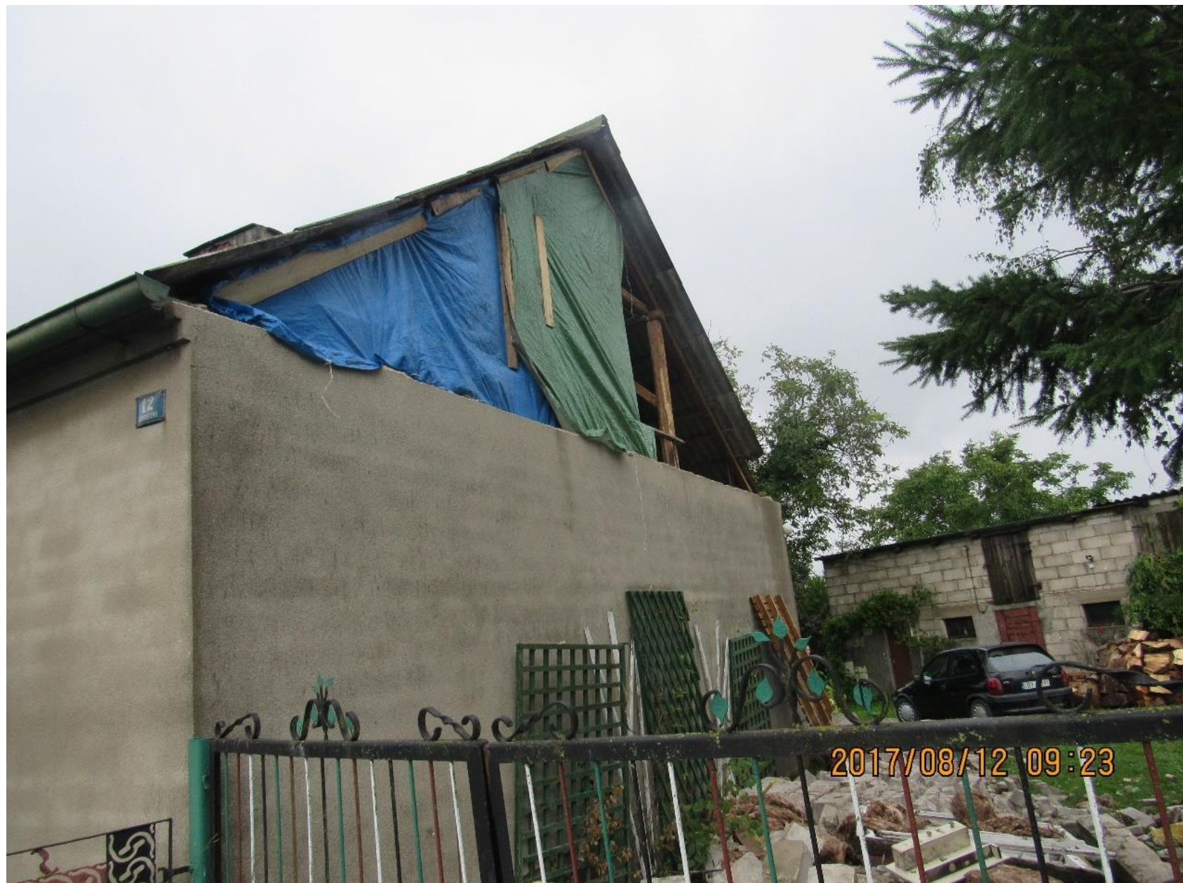
▪ Budynek mieszkalny w Samsiecznie